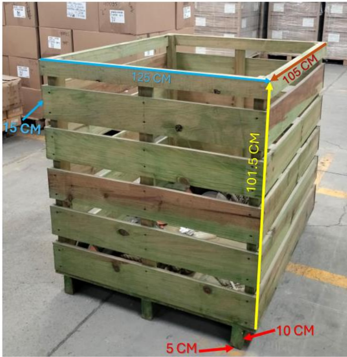
Imagen 1: Foto de referencia del cajón de madera.